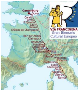
La Via Francigena; sur les pas des pèlerins de Sienna à Radicofani 80km